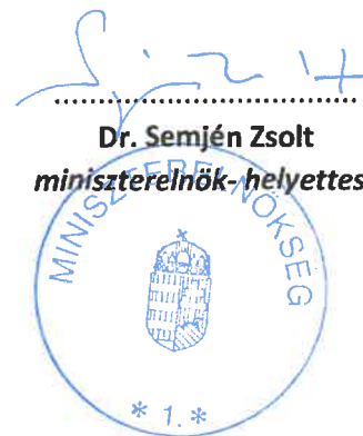
Dr. Semjén Zsolt miniszterelnök-helyettes