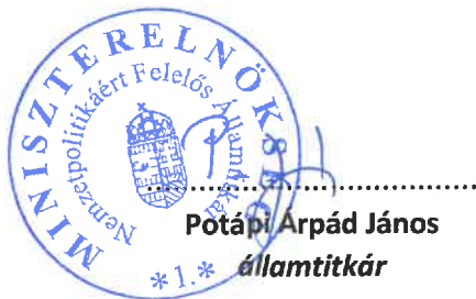
Potápi Árpád János *1.* államtitkár

A Bizottság felhívja a Bethlen Gábor Alapkezelő Zrt.-t, hogy a jelen határozatban foglaltak végrehajtása, illetve a forrás Bethlen Gábor Alapból történő átadása érdekében tegye meg a szükséges intézkedéseket.